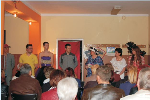
„Teatr w Stodole” gości w gminie str 37