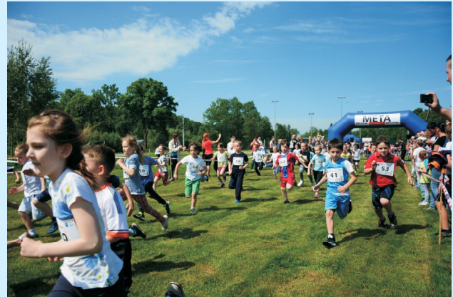
II Bieg „Sieprawska Piątka” str 38