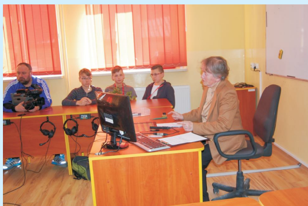
Spotkania z ciekawymi ludźmi „Budujemy mosty” Str 21