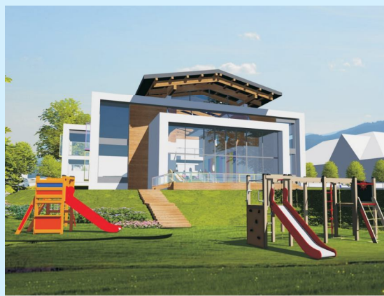
Wizualizacja budynku przedszkola - zadanie inwestycyjne Gminy str 7