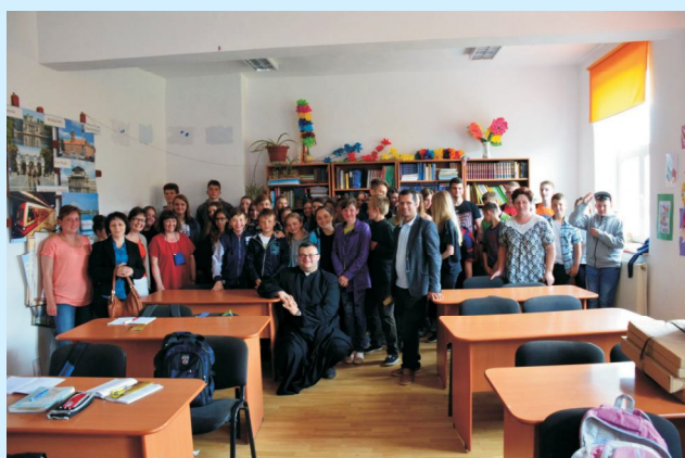
Współpraca Siepraw - Beclean (pobyty młodzieży z Polski w Rumunii) str 15