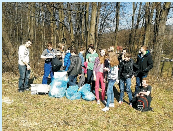
Z życia Gimnazjum w Sieprawiu str 13