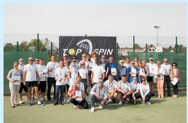
Turniej Tenisa Ziarnego w międzynarodowej obsadzie str 41