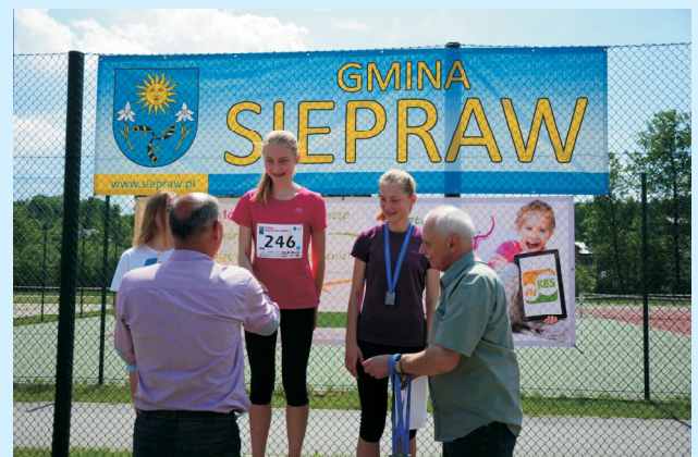
II Bieg „Sieprawska Piątka” str 38