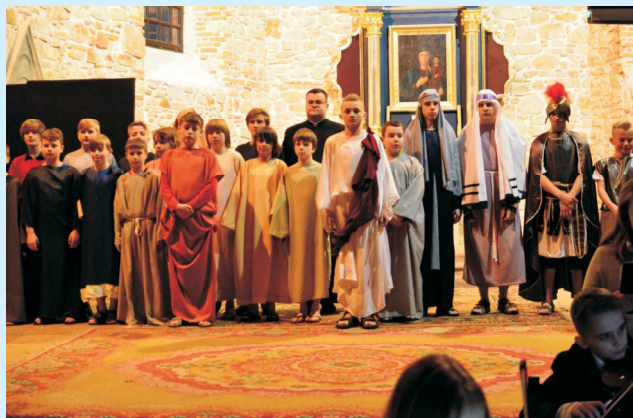
„W poszukiwaniu Mistrza” str 11