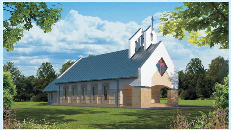
Wizualizacja kaplicy cmentarnej w Zakliczynie str 33