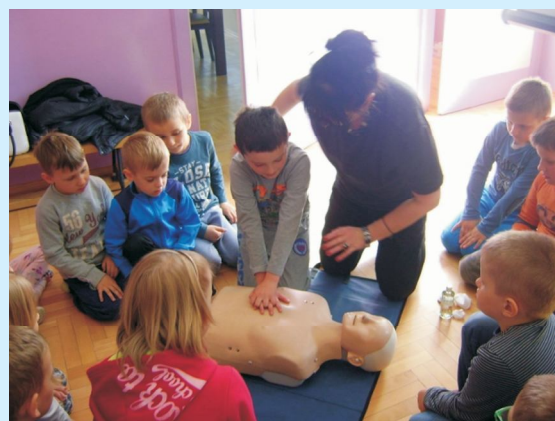
Uczymy się przez działanie str 22