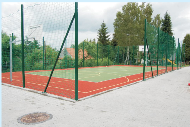
Ogólnodostępne boisko przy Szkole Podstawowej w Zakliczynie str 5