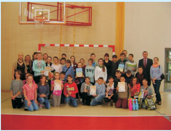
Na mnie zawsze możesz liczyć str 23