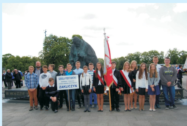
Śladami życia Kardynała Stefana Wyszyńskiego str 20