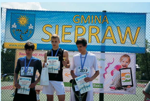
II Bieg „Sieprawska Piątka” str 38