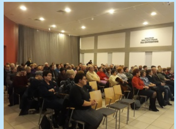
Wyborcze zebrania wiejskie str. 5