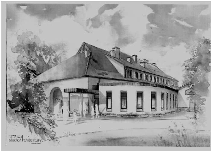
Wizualizacja dobudowanej części administracyjnej do Szkoły Podstawowej w Zakliczynie.

Studio Architektury - Arkadiusz Koliński