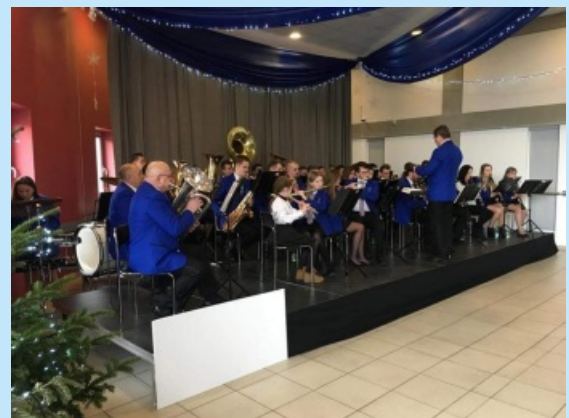
Doposażenie Orkiestry Dętej "Sieprawianka" str. 29