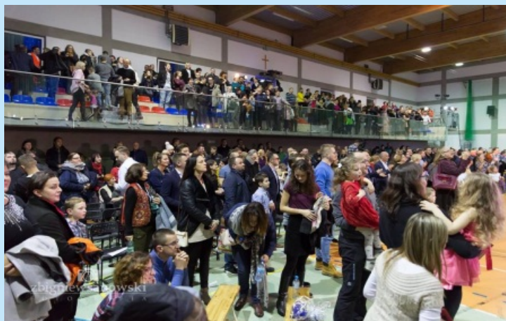
XIII Warsztaty Gospel str. 28