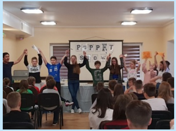
W ZPO w Sieprawiu - Obóz językowy Euroweek str. 26