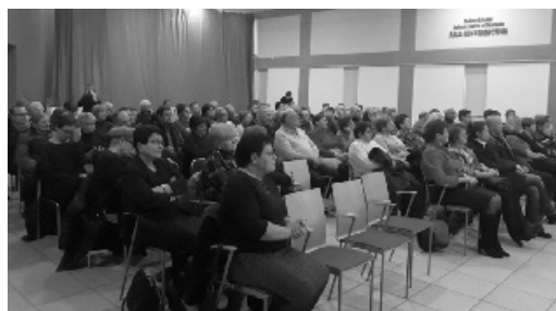
Zebranie wiejskie trzech sołectw z Sieprawia.

W dniach 1-3 lutego 2019 roku odbyły się zebrania wiejskie w Gminie Siepraw, podczas których zostały przeprowadzone wybory sołtysów i członków rad sołeckich w Gminie Siepraw. W każdym sołectwie wybierano jednego Sołtysa i trzech członków Rad Sołeckich. Wybory zostały przeprowadzone przez wybrane w trakcie zebrań komisje skrutacyjne, w skład których weszło po 3 przedstawicieli poszczególnych sołectw.