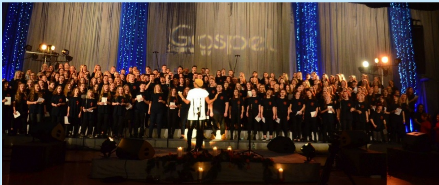
XIII Warsztaty Gospel str. 28