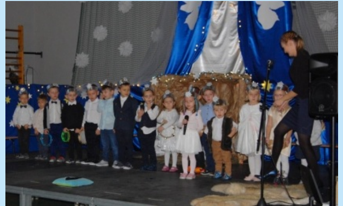
Jasełka i koncert kolęd w Zakliczynie str. 20