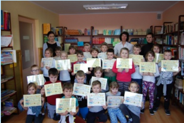
Z życia ZPO w Zakliczynie str. 22