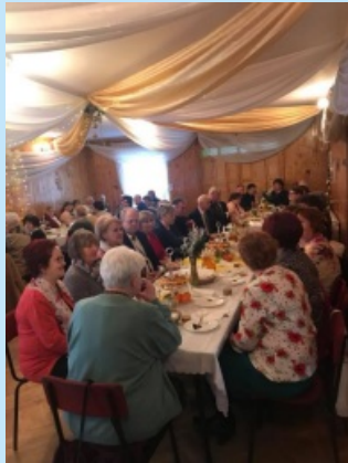
Dzień Seniora w Zakliczynie str. 28