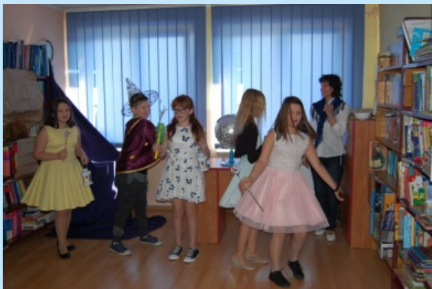
Z życia ZPO w Zakliczynie - promocja czytelnictwa str. 22