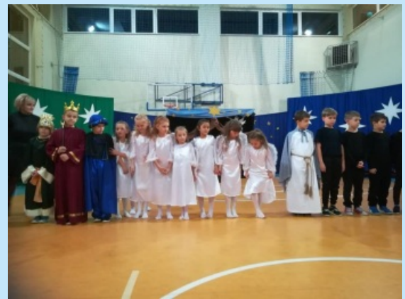
Kiermasz świąteczny w Łyczance (fot.) str. 19