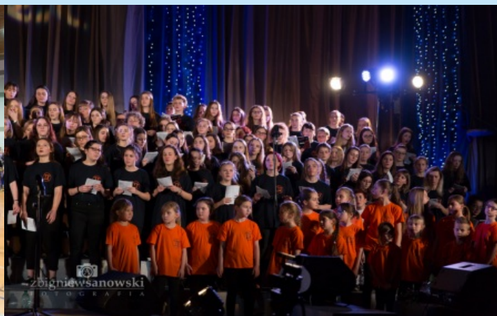
XIII Warsztaty Gospel str. 28