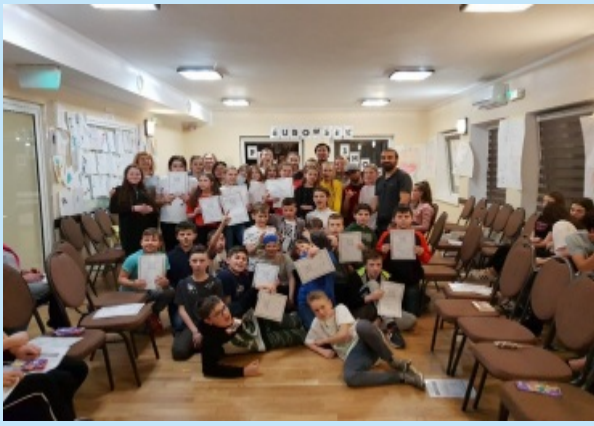
W ZPO w Sieprawiu - Obóz językowy Euroweek str. 26