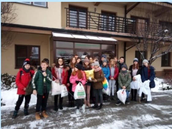
Wolontariusze z Łyczanki w akcji str. 19