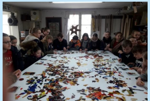
W ZPO w Sieprawiu stawiamy na aktywność uczniów str. 24