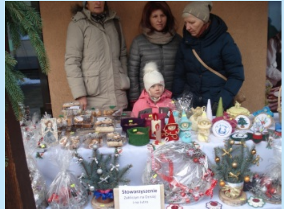
Wigilia uliczna str. 32