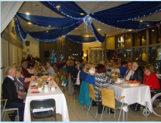
Dzień Seniora w Sieprawiu str. 28