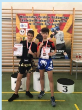
Z życia Szkoły Podstawowej w Czechówce str. 20