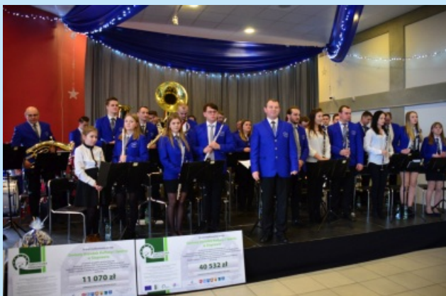
Doposażenie Orkiestry Dętej "Sieprawianka" str. 29