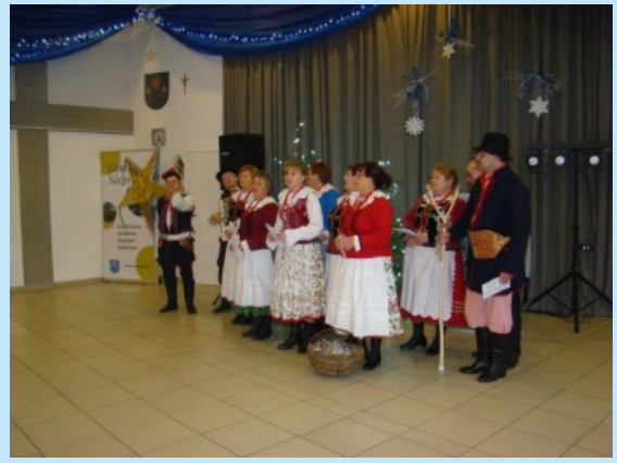
Dzień Seniora w Sieprawiu str. 28