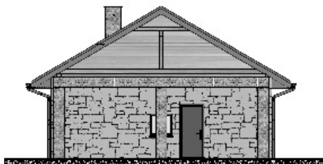
Elewacja południowa projektowanego budynku zaplecza boiska sportowego wraz z wiatą. Rys. M. Łapa