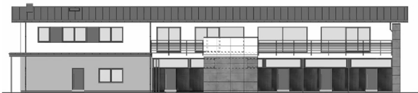
Zaprojektowany nowy budynek zaplecza sanitarno - szatniowego boiska sportowego w Sieprawiu