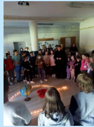
Milioni dzieci modli się na różańcu str. 20