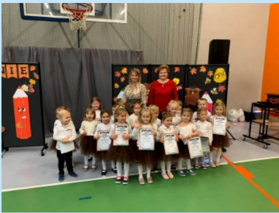
Pasowanie na przedszkolaka w ZPO Zakliczyn str. 14