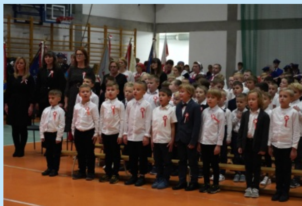
Narodowe Święto Niepodległości str. 11