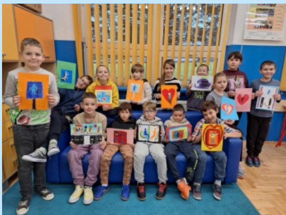
Wyrównujemy szanse str. 16