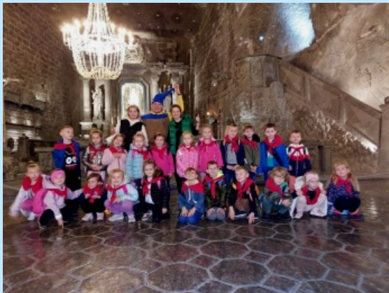
Podróże małe i duże str. 15