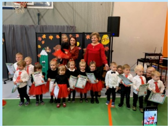
Pasowanie na przedszkolaka w ZPO Zakliczyn str. 14