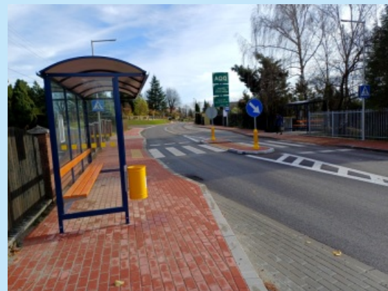
Remont ul. Jana Pawła II str. 7