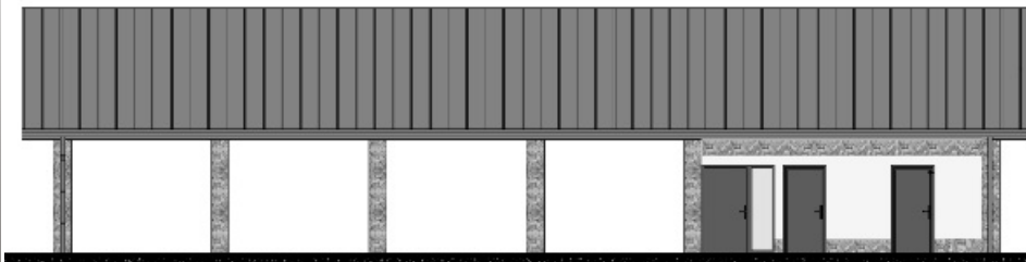
Elewacja wschodnia projektowanego budynku zaplecza boiska sportowego wraz z wiatą. Rys. M. Łapa