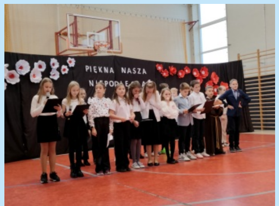
Święto Niepodległości w SP w Czechówce str. 17