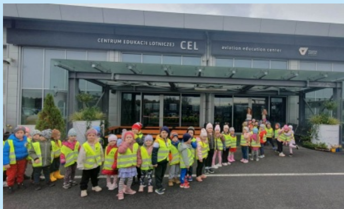
Kotki i Misie na Balicach str. 12