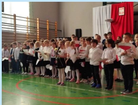
Święto Niepodległości w ZPO Zakliczyn str. 13