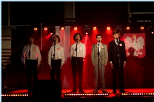
Narodowe Święto Niepodległości str. 11