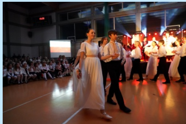
Narodowe Święto Niepodległości str. 11