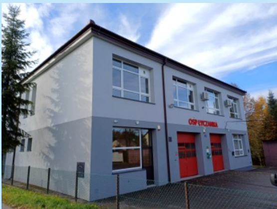
Termomodernizacja Strażnicy w Łyczance str. 7