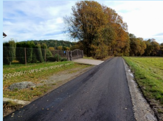
Remont ul. Dworskiej str. 7