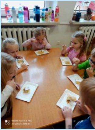
Dzień papieski str. 20