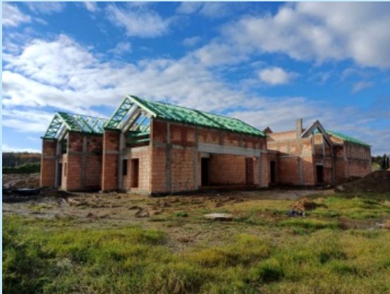
Budowa przedszkola w Zakliczynie str. 7