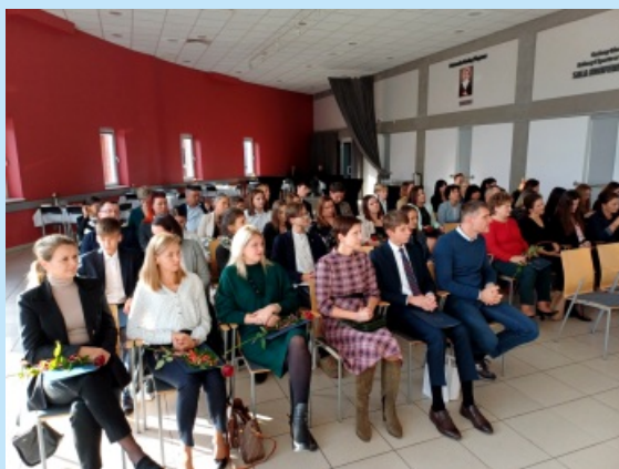
Wyjątkowy dzień edukacji str. 5