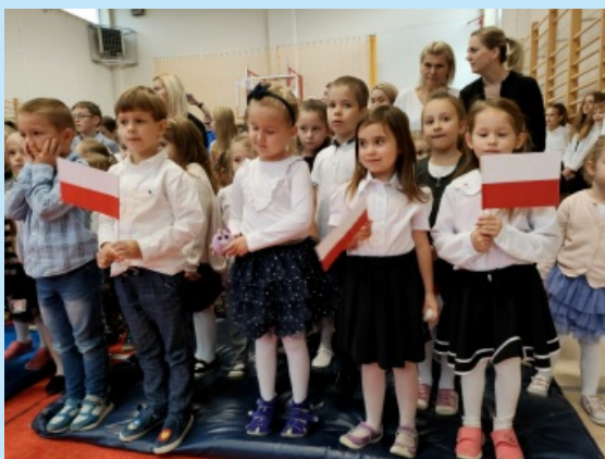
Święto Niepodległości w SP w Czechówce str. 17