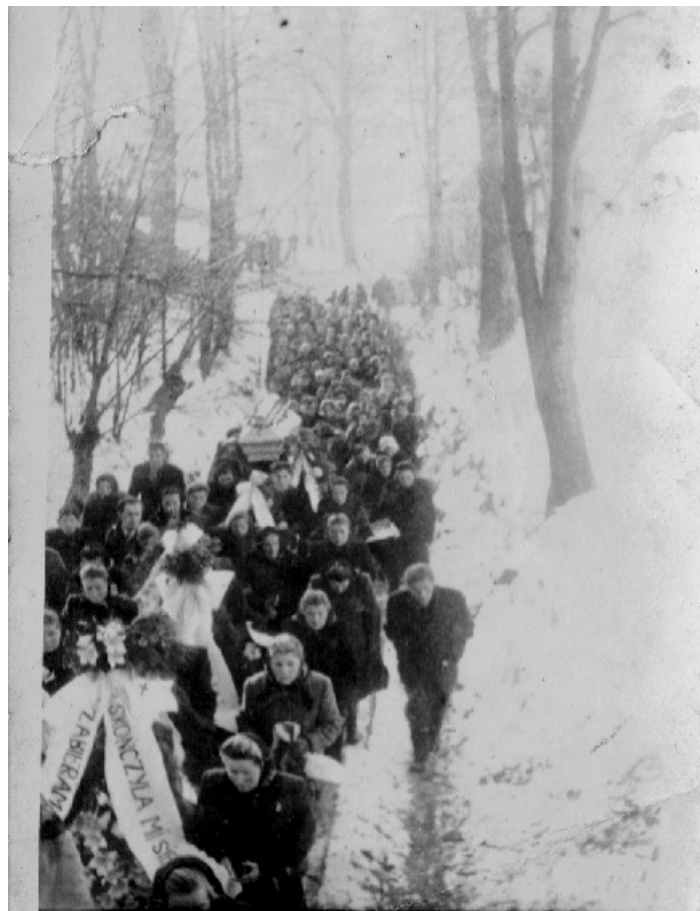
Kondukt pogrzebowy zbliża się do kościoła parafialnego schodami obok Kapliczki Trzeciego Upadku. (Uroczystości pogrzebowe w dniu 4 stycznia 1945 roku).