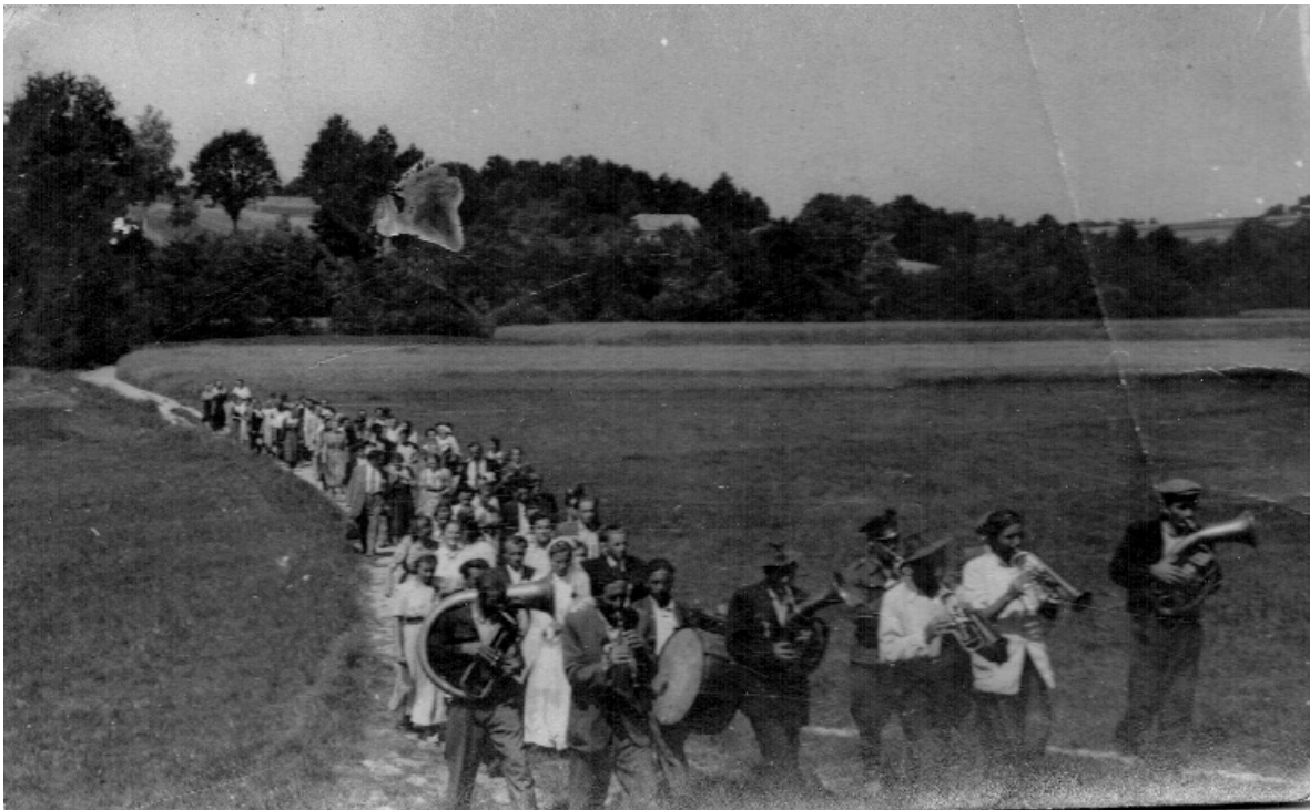
Orszak ślubny dochodzi do szczytu Uliczki i skręca w stronę Kapliczki Trzeciego Upadku. (Uroczystości ślubne w dniu 4 lipca 1953 roku).