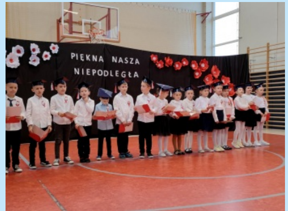
Ślubowanie pierwszoklasistów w SP Czechówka str. 17