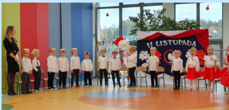
Narodowe Święto Niepodległości w Przedszkolu str. 12