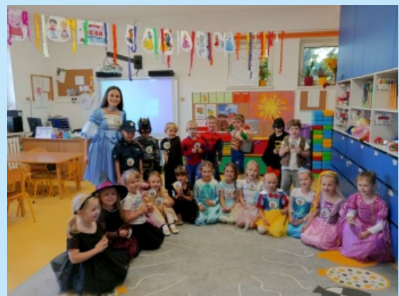
Bajkowe świętowanie str. 22