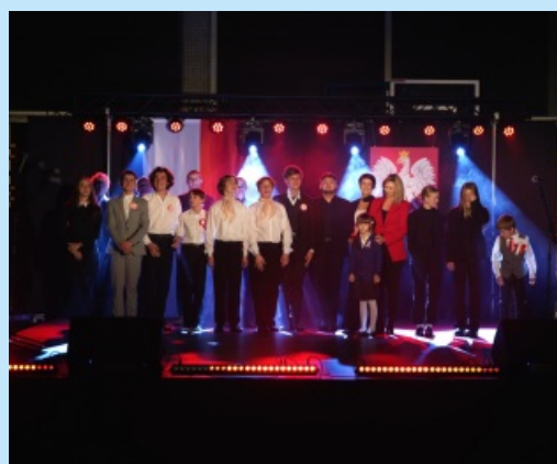
Narodowe Święto Niepodległości str. 11