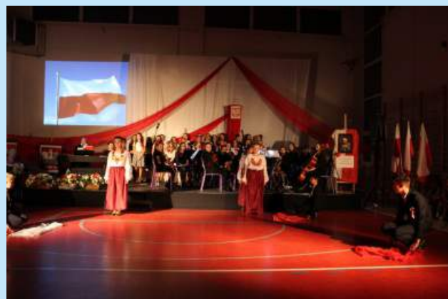
Gminne uroczystości patriotyczne str. 15