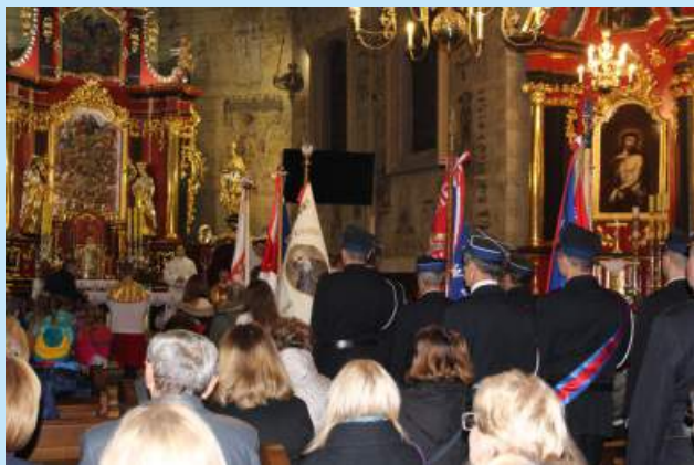
Gminne uroczystości patriotyczne str. 15