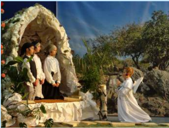
“Fatima” - przedstawienie teatralne w Łyczance str. 22