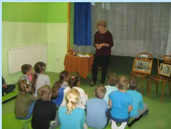
Cała Polska czyta dzieciom str. 11