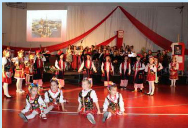
Gminne uroczystości patriotyczne str. 15