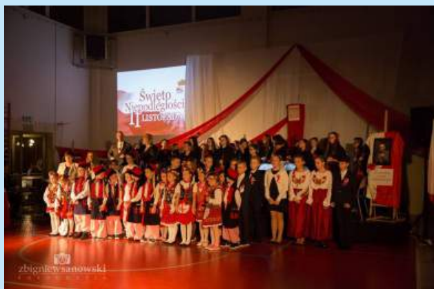
Gminne uroczystości patriotyczne str. 15