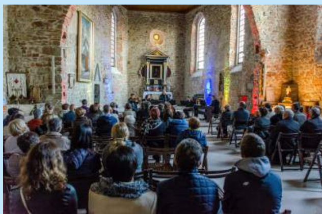
Uczta duchowa z Noro - Lim str.18