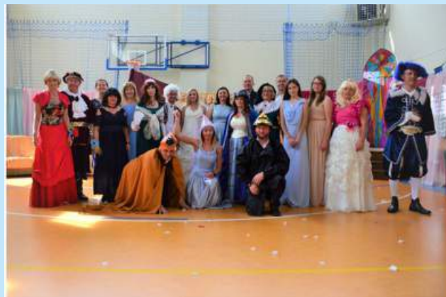
Projekt “Życie teatralne strażnicy” - sztuka w służbie integracji społeczeństwa str. 23