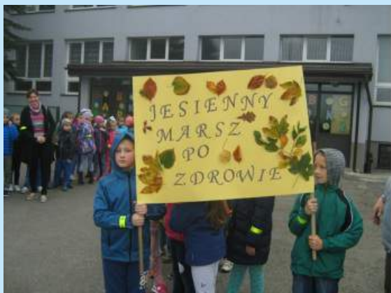
Jesienny marsz po zdrowie str. 11