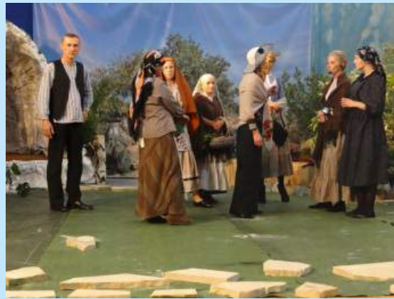
“Fatima” - przedstawienie teatralne w Łyczance str. 22