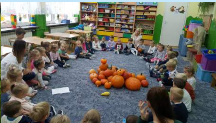
Święto dyni str. 13