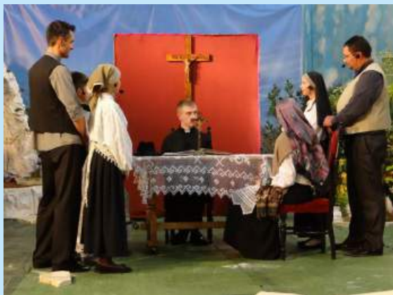
“Fatima” - przedstawienie teatralne w Łyczance str. 22