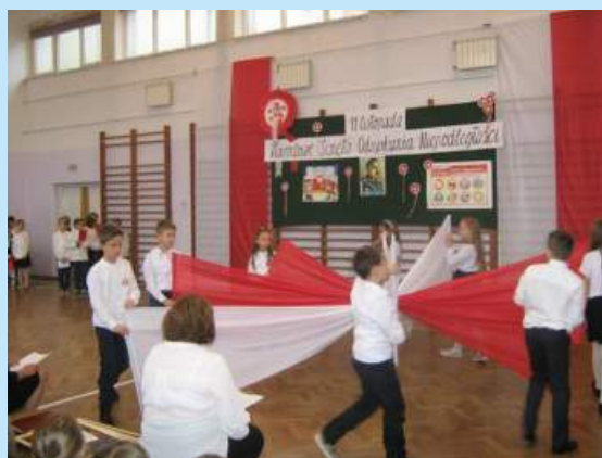
99 rocznica odzyskania niepodległości str. 10