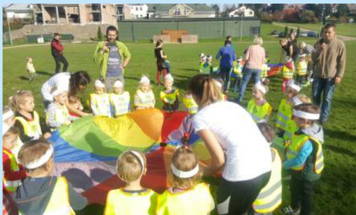
Święto pieczonego ziemniaka str. 13