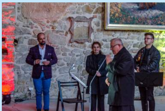
Uczta duchowa z Noro - Lim fot. ks. W. Gazdowicz. str. 18