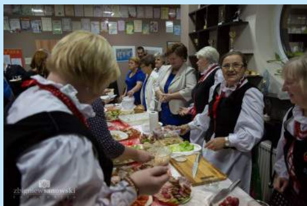
Gminne uroczystości patriotyczne str. 15