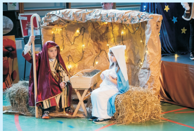
Jasełka i koncert kolęd w Zakliczynie str. 17