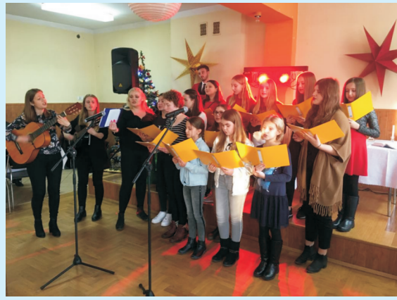
Spotkanie opłatkowe str. 18