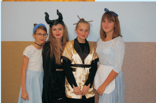
Imprezy czytelnicze str. 20