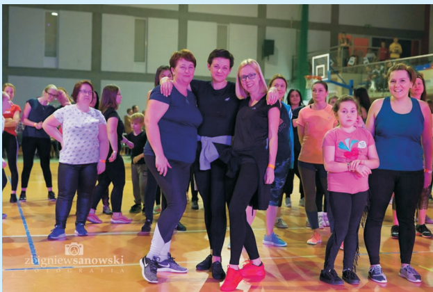
Zumbowo, słodko, świątecznie str. 16