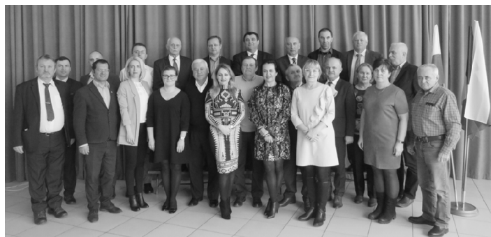
Wspólne zdjęcie przedstawicieli partnerskich gmin Sieprawia, Beclean i Spiskiego Czwartku.