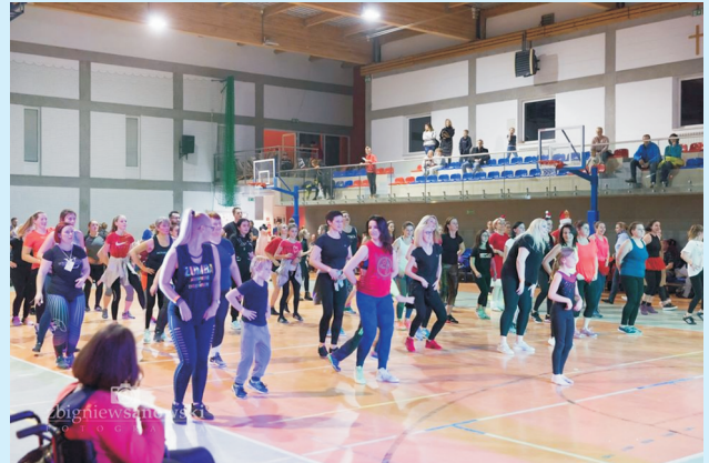
Zumbowo, słodko, świątecznie str. 16