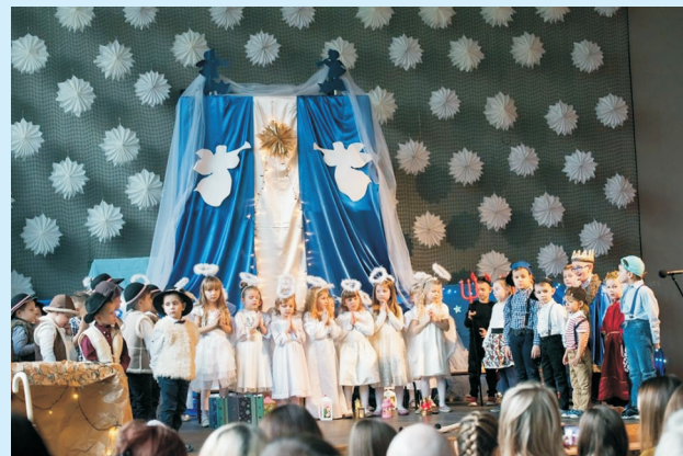
Dzień babci i dziadka w Zakliczynie str. 20