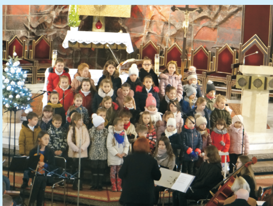
Koncert kolęd str. 17