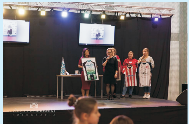
Zumbowo, słodko, świątecznie str. 16