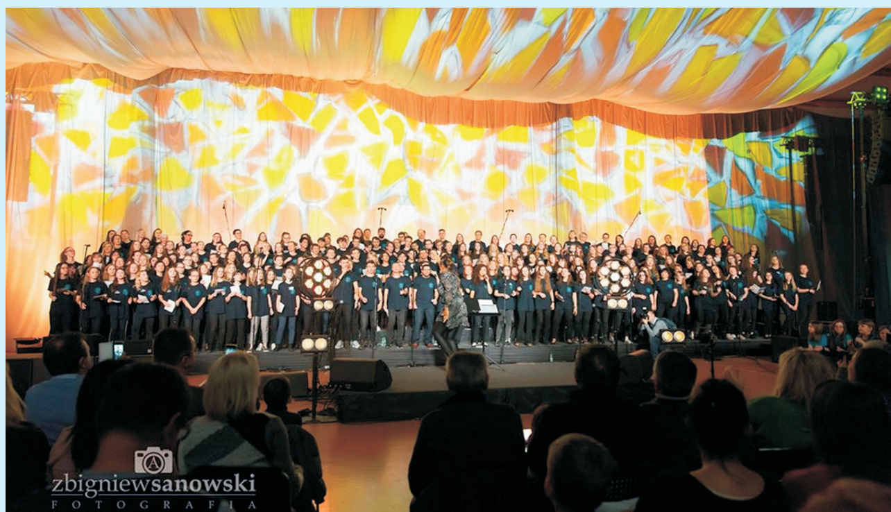
Warsztaty GOSPEL str. 25