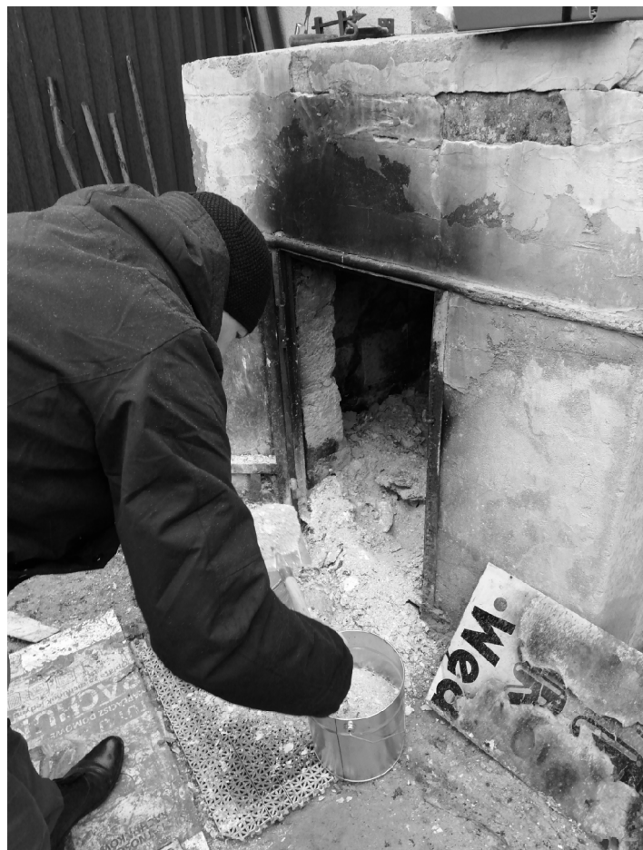
Pracownik Urzędu Gminy podczas pobierania próbek popiołu do analizy.

W roku 2019 przeprowadzono łącznie 21 kontroli, natomiast w 2020 roku - 16 kontroli. Większość to kontrole