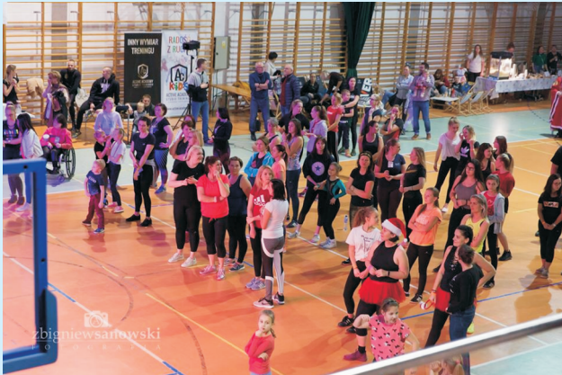
Zumbowo, słodko, świątecznie str. 16