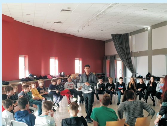
Warsztaty językowe str. 22