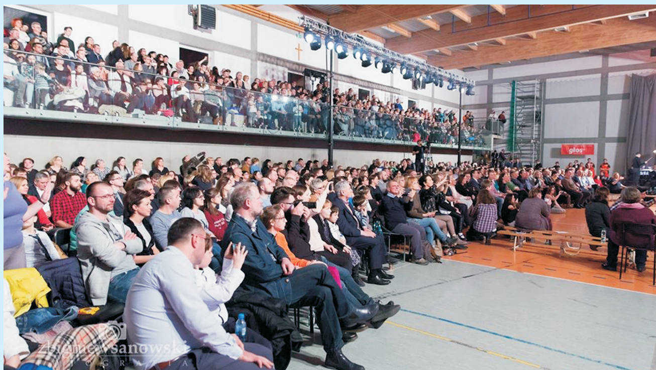
Warsztaty GOSPEL str. 25