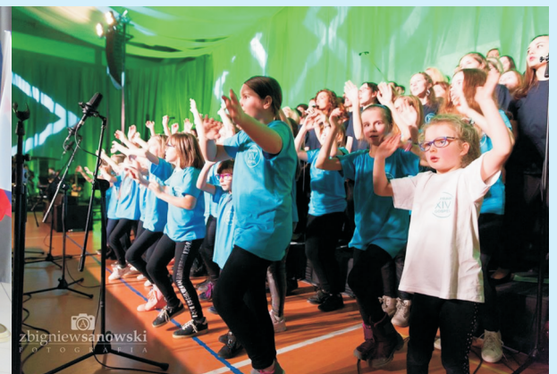
Warsztaty GOSPEL str. 25