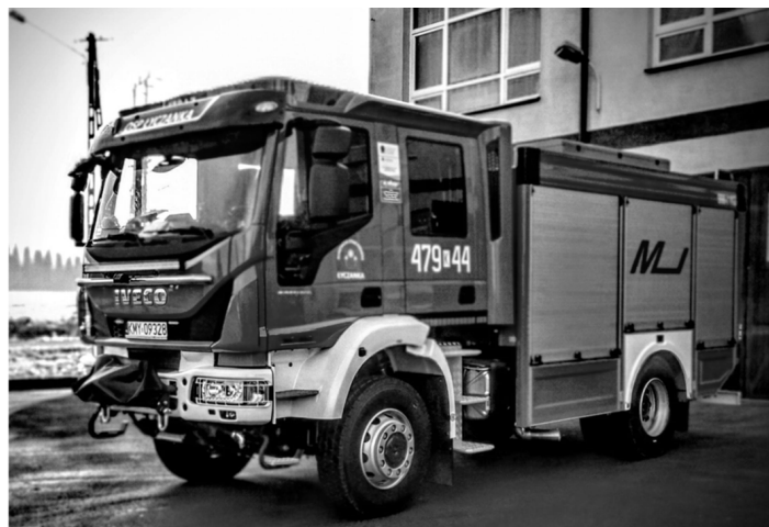
Nowy samochód bojowy OSP Łyczanka.