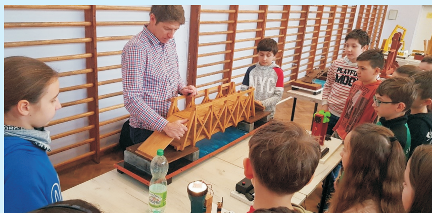
Modele edukacyjne str. 21