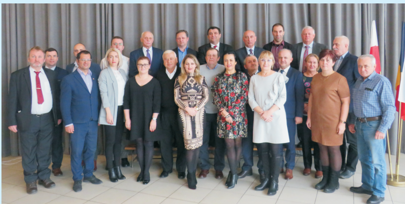
Podwójna wizyta str. 11