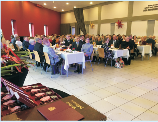
Spotkanie opłatkowe str. 18