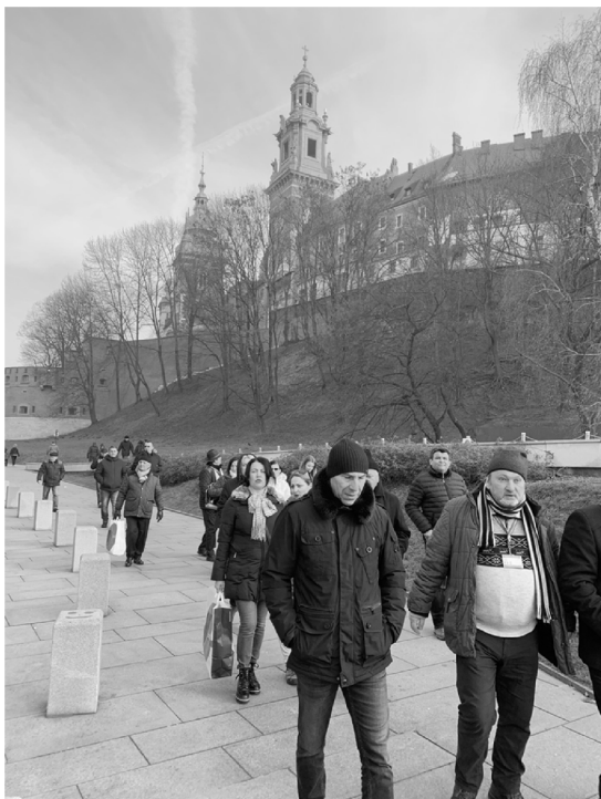
Delegacje partnerskich gmin podczas wycieczki do Krakowa.