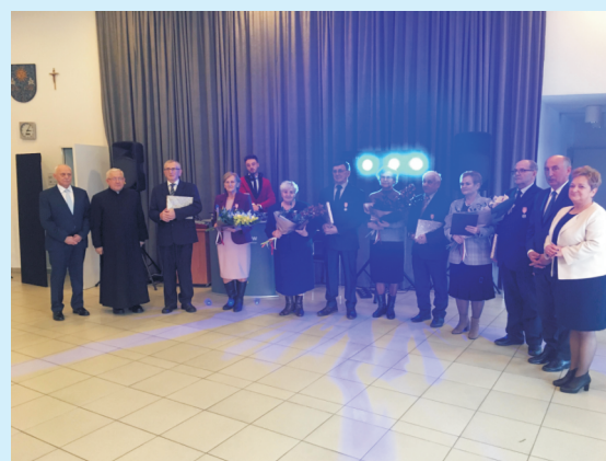
Spotkanie oplatkowe str. 18