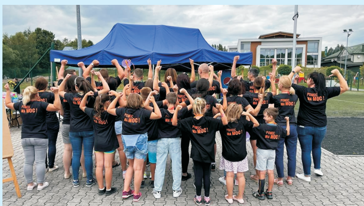
Pomoc ma moc str. 18