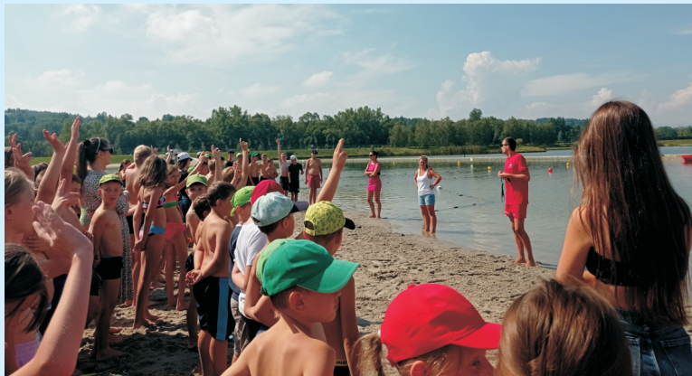
Półkolonia str. 8