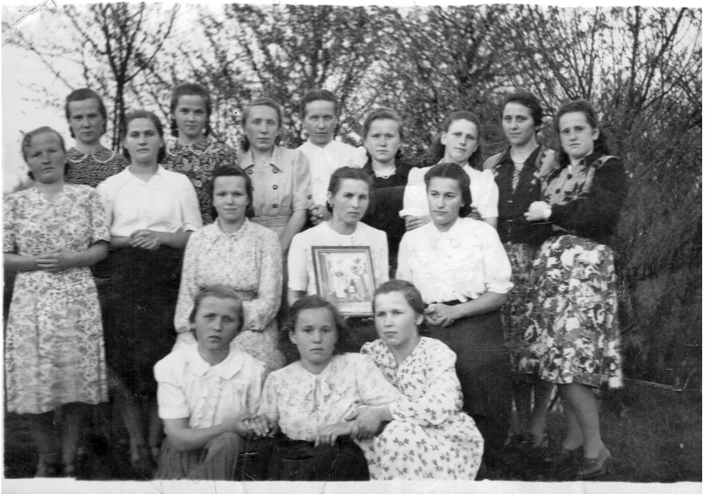
Fotografia wykonana ok. 1950r. Róża różańcowa panien z Łysej Góry I i II.