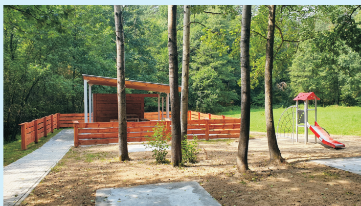
Ścieżki str. 4