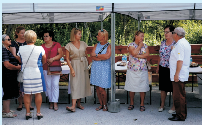
Ścieżki str. 4