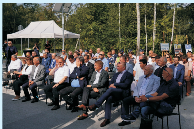
Ścieżki str. 4