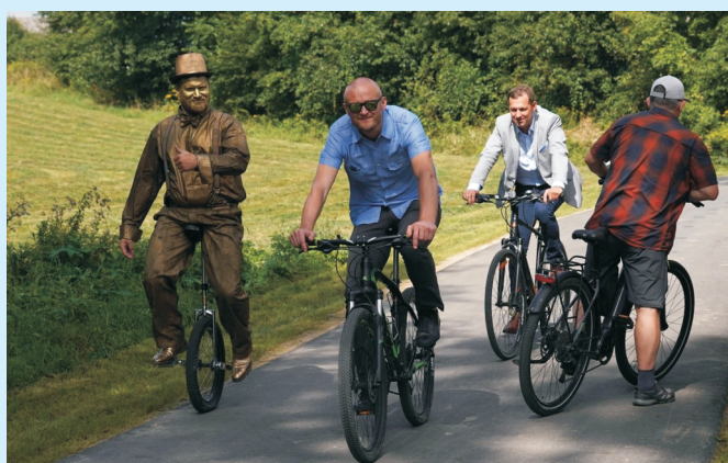
Ścieżki str. 4