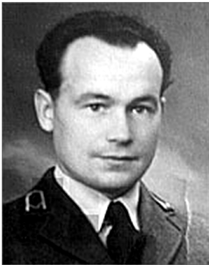
Zdjęcie Cypriana Króla