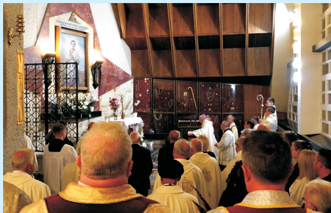
Aniela patronką Gminy str. 7