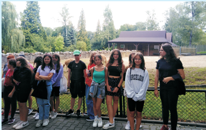
Półkolonia str. 8