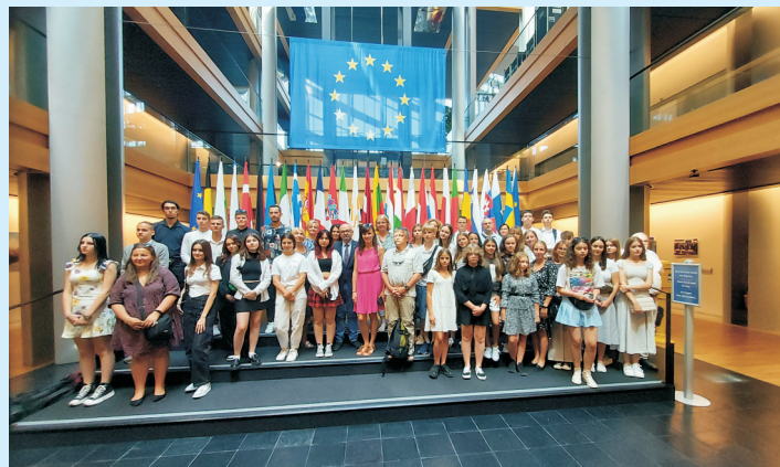
Parlament europejski str. 15