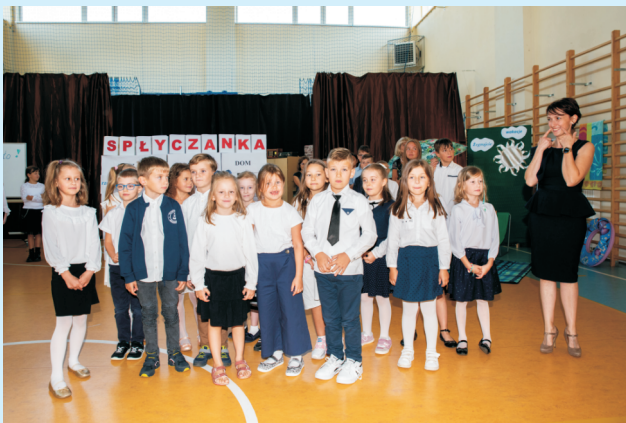
Witaj szkolo str. 14