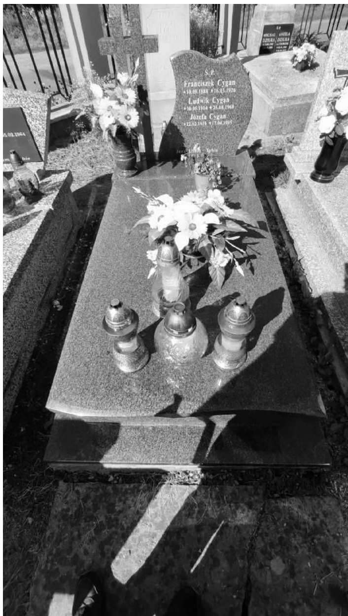
Grób Ludwika Cygana na cmentarzu w Sieprawiu