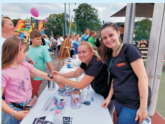
Pomoc ma moc str. 18