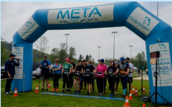
Sieprawska Piątka str. 21