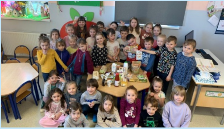
Ekologicznie w przedszkolu Str. 18