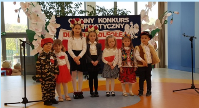
Gminny Konkurs Dla Niepodległej str. 10