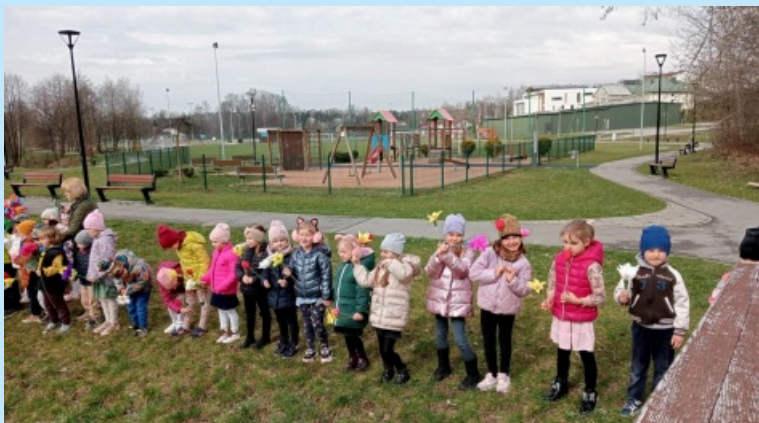
Kronika wydarzeń str. 9