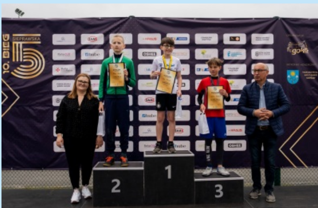
Sieprawska Piątka str. 21