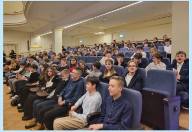
Różne oblicza kultury str. 16