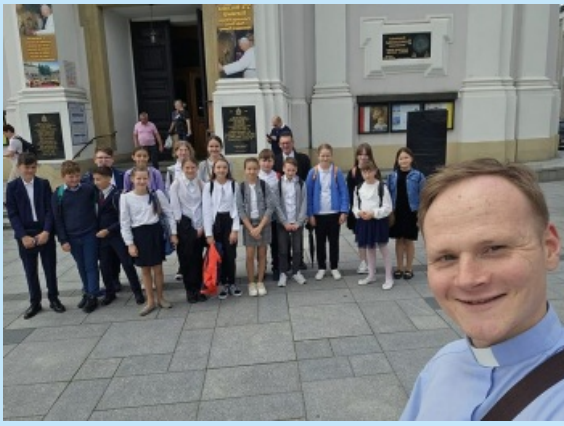
Konkursy religijne str. 14