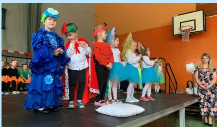
Dzień mamy i taty str. 18