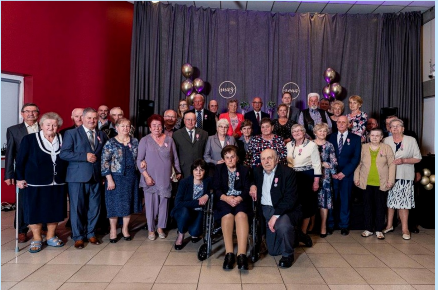
Medale dla par małżeńskich str. 4