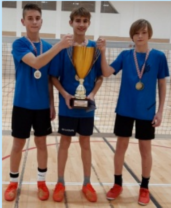
ZPO Zakliczyn na sportowo str. 17