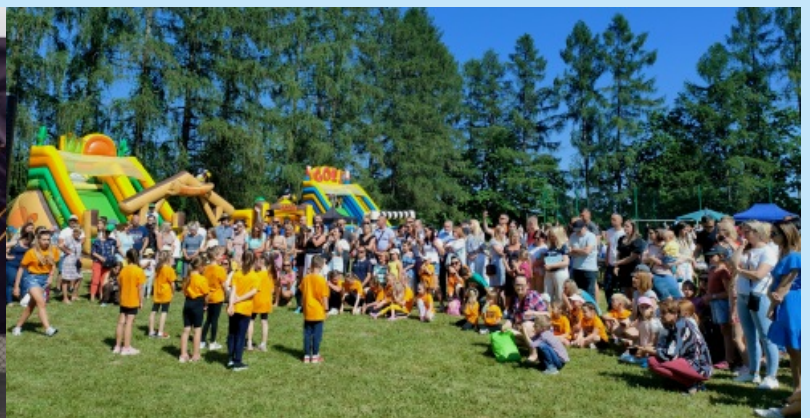
Gminny Dzień dziecka str. 21