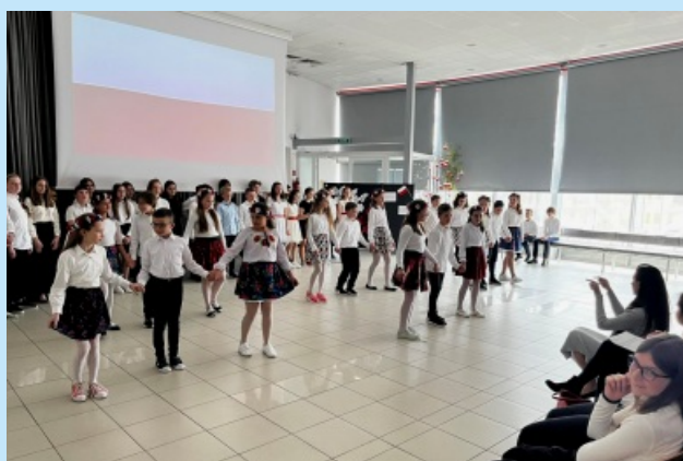
Pamiętamy o świętach narodowych str. 10