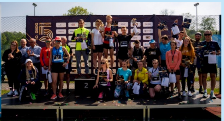
Sieprawska Piątka str. 21