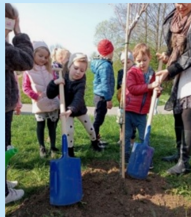
Kronika wydarzeń str. 9