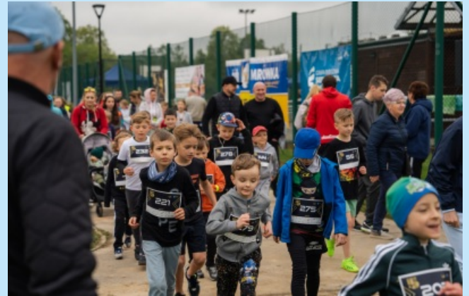
Sieprawska Piątka str. 21