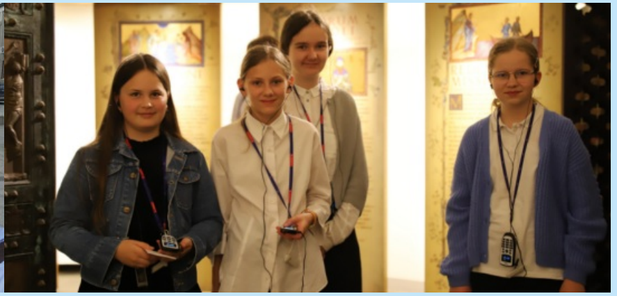
Konkursy religijne str. 14