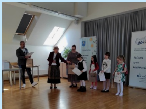
Gminny Konkurs Recytatorski str. 20