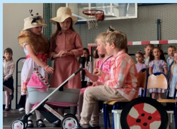
Dzień mamy i taty str. 18