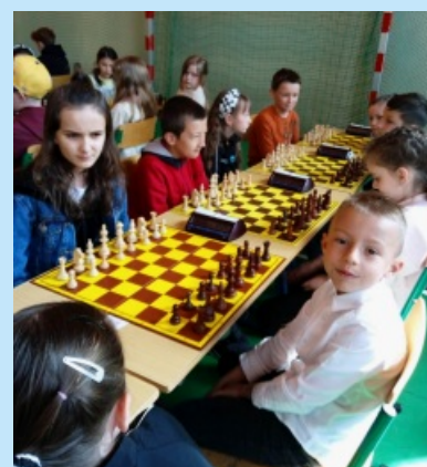
Szachy str. 15