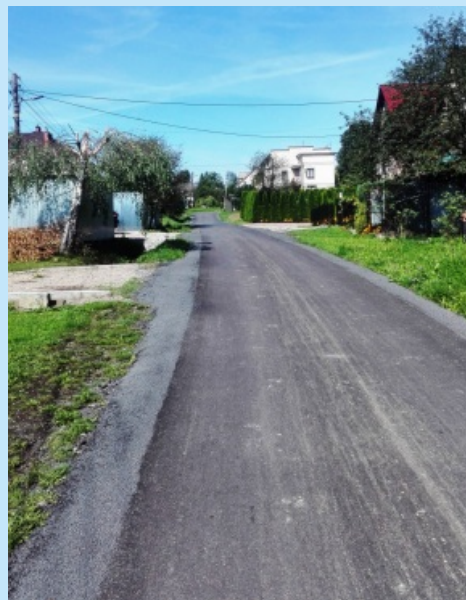
Remont drogi rolniczej, boczna od ul Zarusinki (170m) w Sieprawiu str. 6