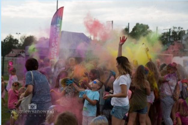
Piknik w Sieprawiu str. 21