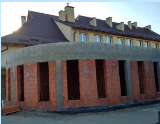
Przebudowa Szkoły Podstawowej w Zakliczynie (dobudowa dwóch sal lekcyjnych oraz zaplecza administracyjnego) str. 12