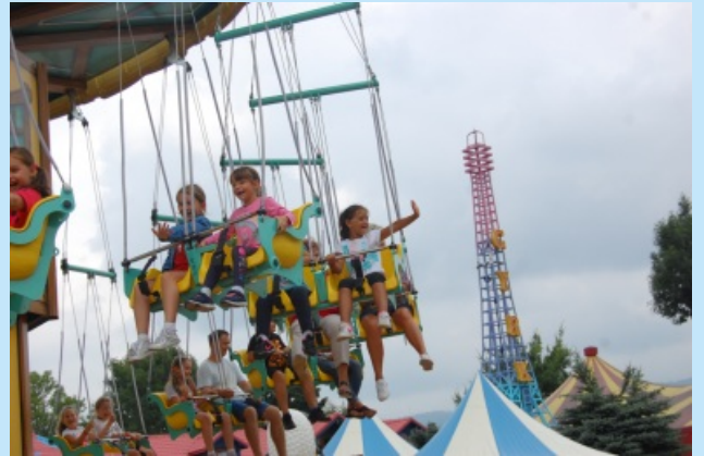
Letnie półkolonie 2019 str. 19