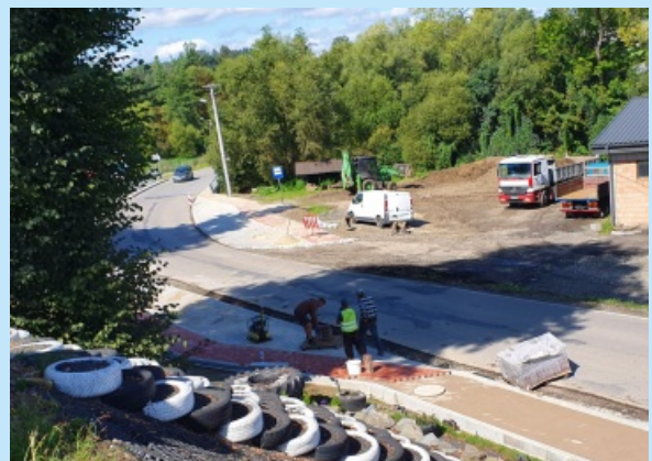
Chodnik z zatokami autobusowymi na ul. Kawęciny w Sieprawiu (inwestycja powiatowa dofinansowana przez Gminę) str. 6