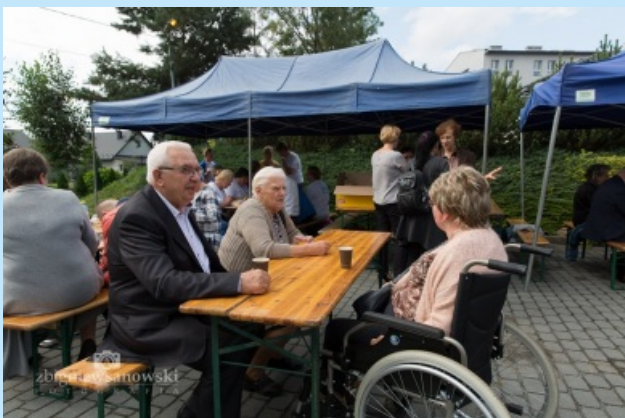
Piknik integracyjny str. 21