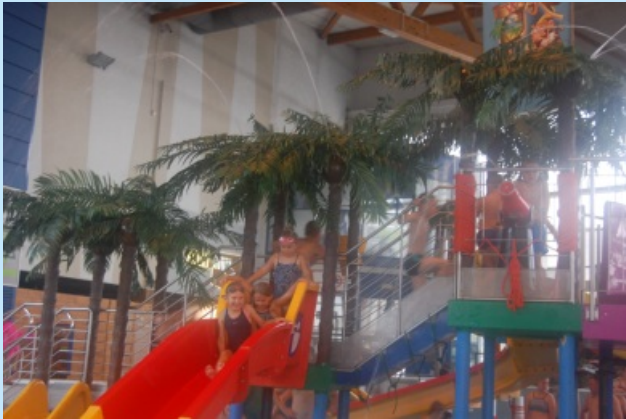
Letnie półkolonie 2019 str. 19