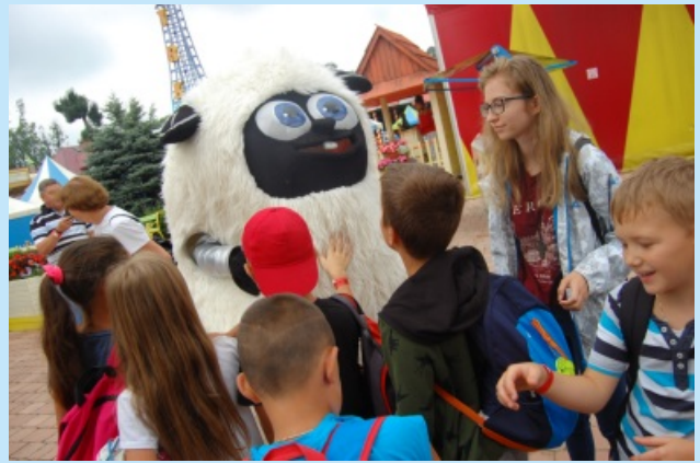
Letnie półkolonie 2019 str. 19