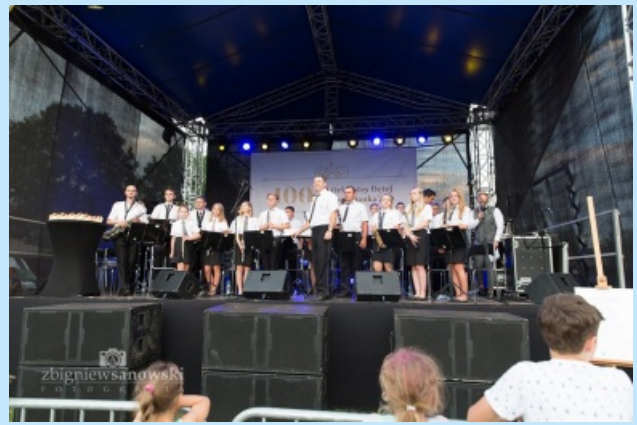
Jubileusz orkiestry str. 20