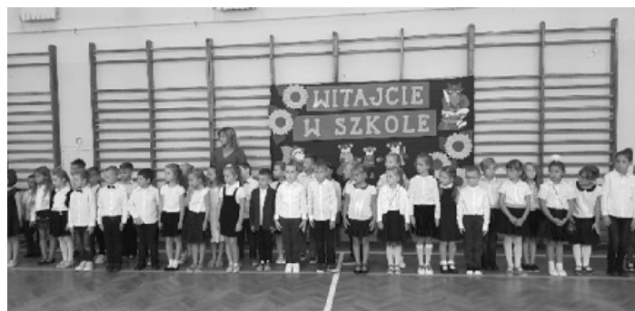
Ślubowanie klas pierwszych w ZPO w Sieprawiu - 2 września 2019 r.