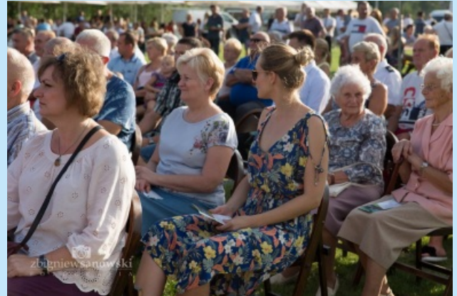
Piknik w Sieprawiu str. 21