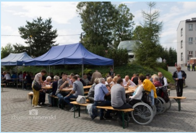
Piknik integracyjny str. 21