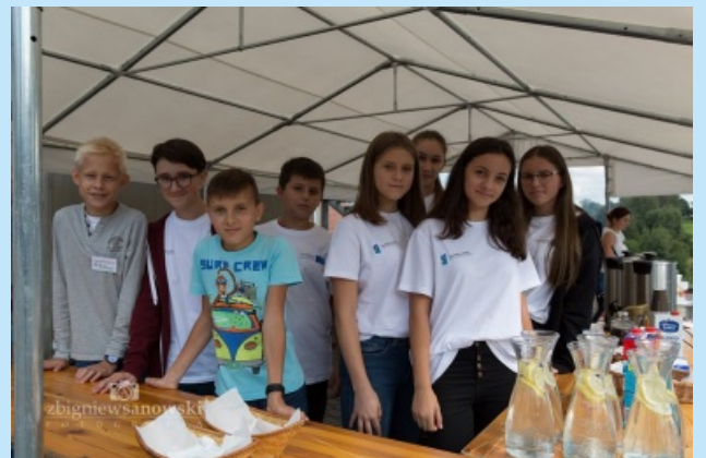
Piknik integracyjny str. 21