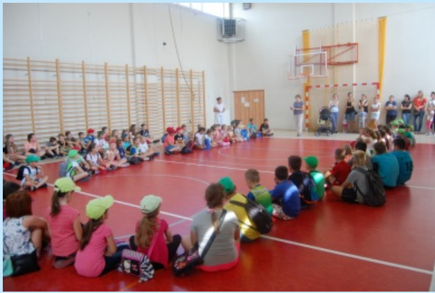
Letnie półkolonie 2019 str. 19