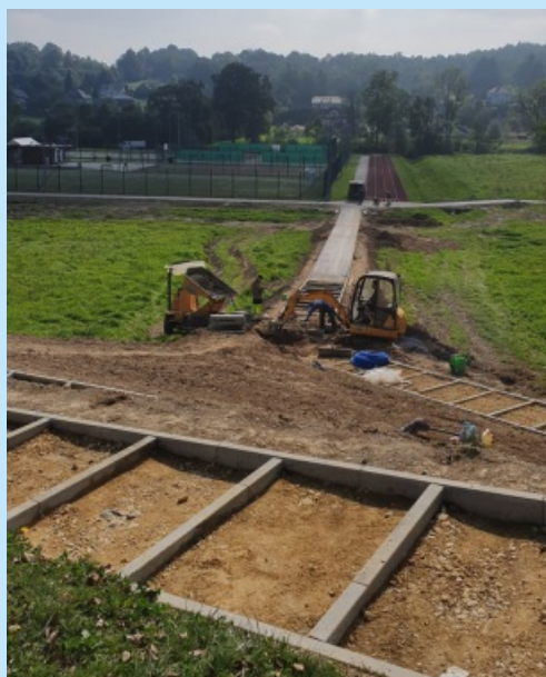
Budowa Parku Słonecznego w Sieprawiu - II etap str. 6