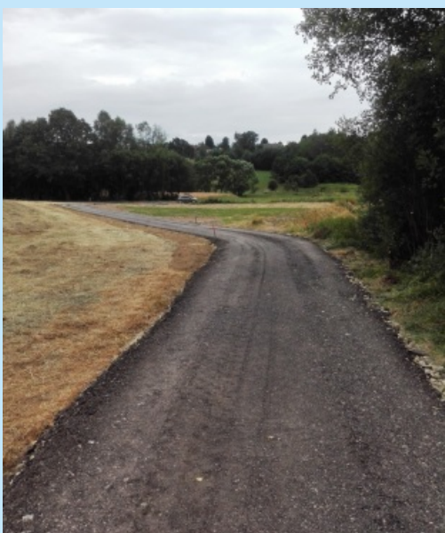
Remont drogi rolniczej, boczna od ul Długiej (323m) w Sieprawiu str. 6