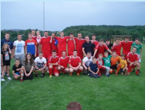
Drużyna Jordan Sum z fanami po awansie do "okręgówki" str. 24