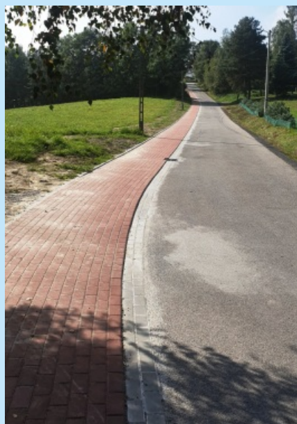
Chodnik na ul. Podgórskiej (156m) w Zakliczynie str. 6