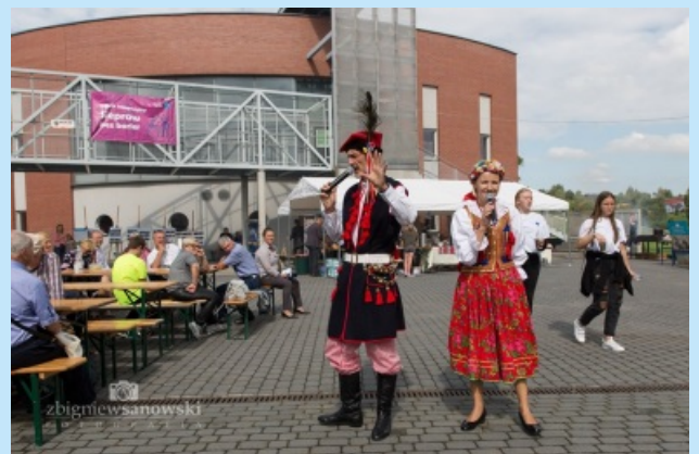
Piknik integracyjny str. 21