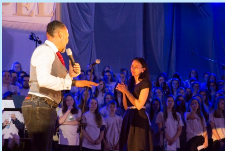
Jubileuszowe X Ogólnopolskie Warsztaty Gospel w Sieprawiu str. 29

(fot.3 w artykule) Rejon karczmy i targowiska w Sieprawiu w 1847r. (Wg. ANK Kataster Galicyjski, Siepraw 1847 sygn. K. Myśl.61) Widać murowane budynki nad rzeką Sieprawką.