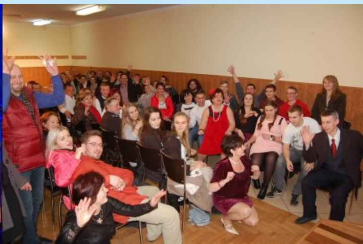
“WUJASZEK” - Teatr w Stodole str. 31