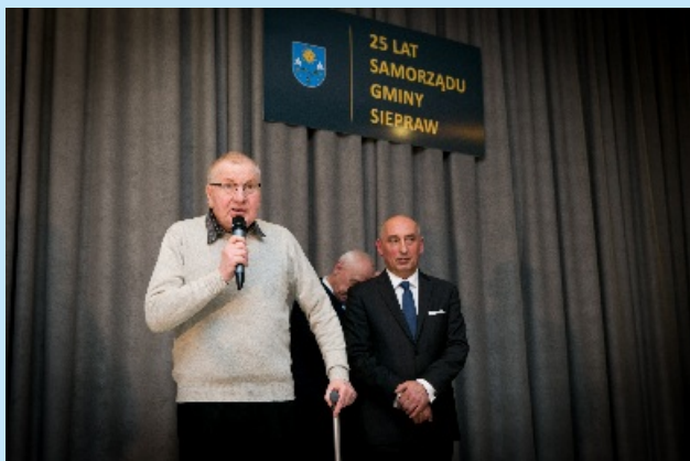
Samorządowe spotkanie oplatkowe str. 12