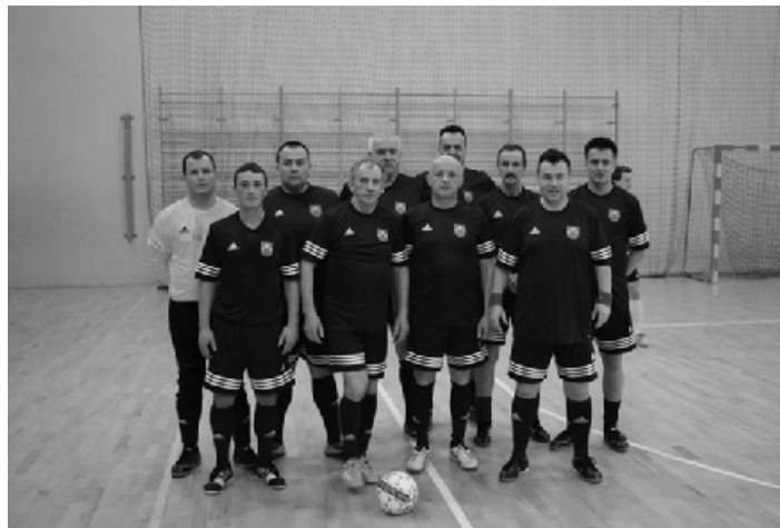
Fot. Piotr Magiera

https://www.facebook.com/MOSMyslenice/timeline