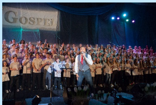
Jubileuszowe X Ogólnopolskie Warsztaty Gospel w Sieprawiu str. 29