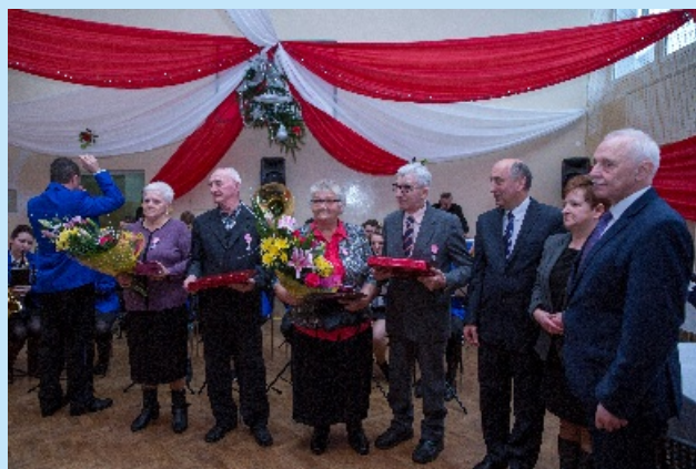
Dzień Seniora w Sieprawiu str. 14