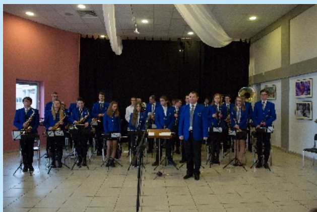
Jest w Orkiestrach Dętych jakaś siła... str. 12