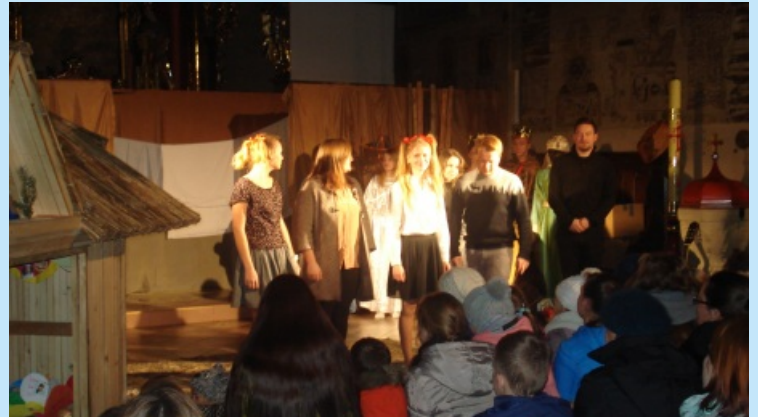
Jasełka "Na Strychu" str. 11