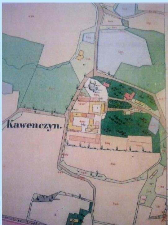
Zespół Dworski w Kawęczynach w II połowie XIX wieku... str. 25

(fot.2 w artykule) Zespół dworski w Kawęczynach w 1847r. (Wg. ANK Kataster Galicyjski, Siepraw 1847 sygn. K. Myśl.61) Widać dwór z parkiem i częścią rezydencjonalną oraz część gospodarczą.