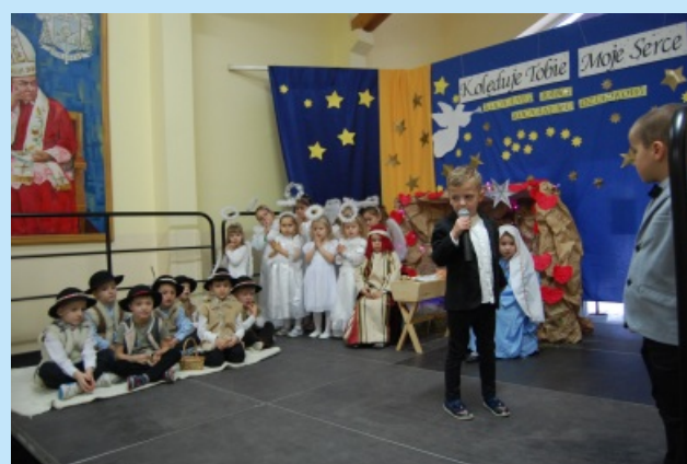
Kolędowanie w przedszkolu w Zakliczynie Str.18