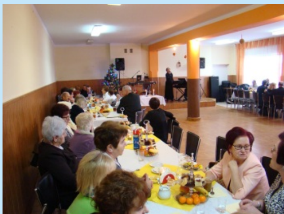
Seniorzy Parafii Zakliczyn kolędują str. 14