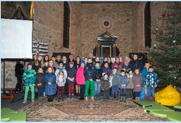
XV Konkurs Szopek Tradycyjnych i Krakowskich str. 9