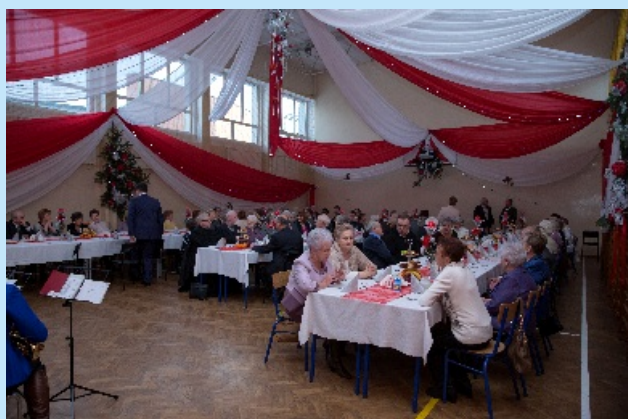
Dzień Seniora w Sieprawiu str. 14