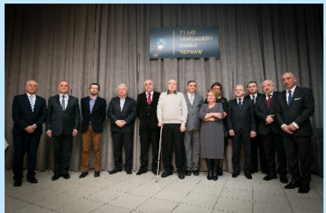
Samorządowe spotkanie oplatkowe str. 12