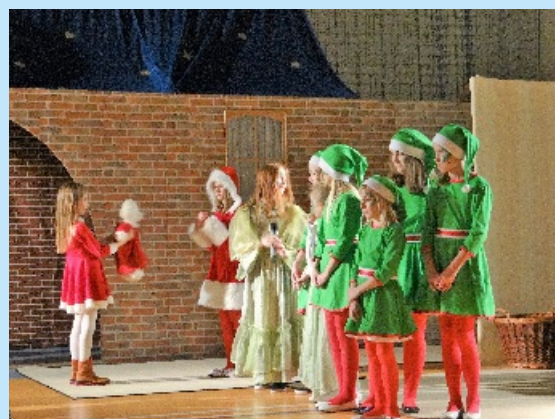
Koncert charytatywny w Szkole Podstawowej w Lyczance str. 16