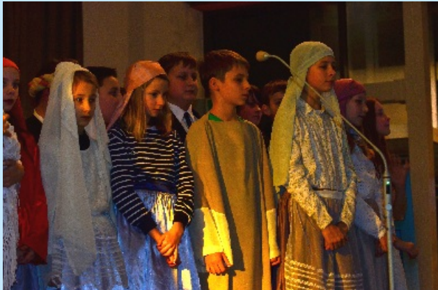
Bóg przychodzi we właściwym czasie str. 11