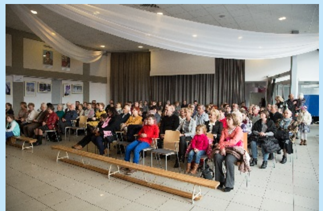
Jest w Orkiestrach Dętych jakaś siła... str. 12