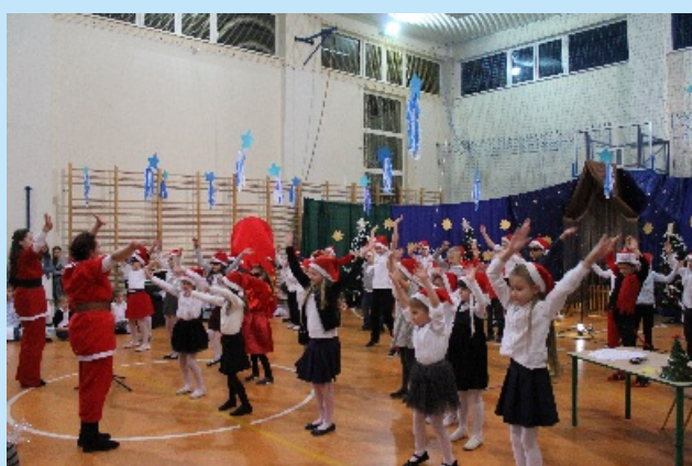
Świąteczne Spotkanie przy Choince w Lyczance str. 16